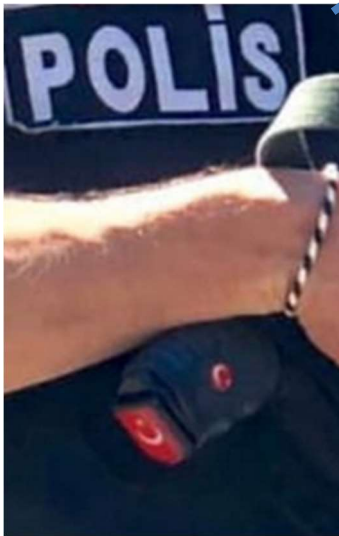
Werbefoto Canik TP9SF Elite-S