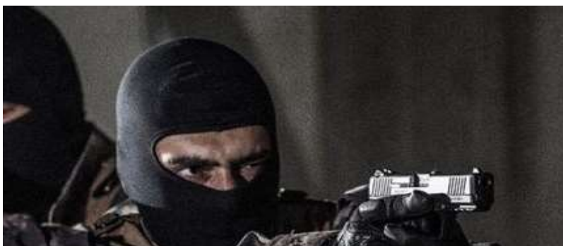
Canik TP9SF Elite-S in Verwendung des türkischen Militärs